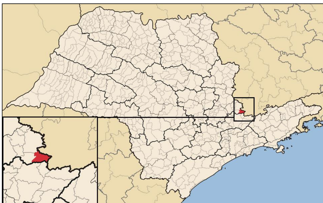
Figura 1 – Localização do município de PEDRA BELA

Segundo o estudo do SEADE “Projeção da População e dos Domicílios para os municípios do Estado de São Paulo: 2010-2050”, as estimativas para o município, em 2018, foram: